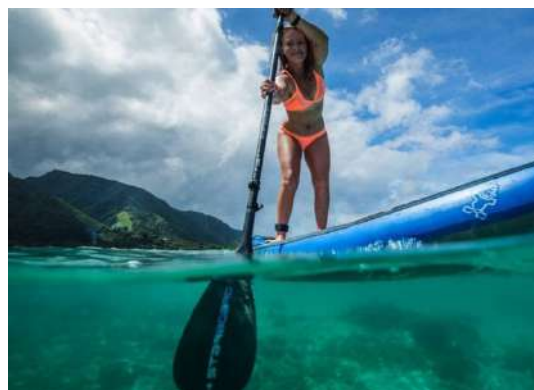
SUP, CORSO PER ISTRUTTORI NAZIONALI AiCS