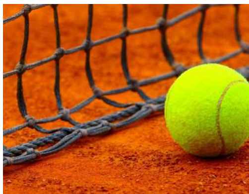
TENNIS, CORSO PER ISTRUTTORI NAZIONALI AiCS