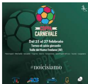
COPPA CARNEVALE 2022, NON SOLO CALCIO

Vi aspettiamo dal 25 al 27 Febbraio 2022 per vivere a pieno l'esperienza della Coppa Carnevale.