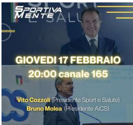
SPORTIVAMENTE, "LA RIPARTENZA POST COVID DELLO SPORT DI BASE" AL CENTRO DELLA PUNTATA DEL 17 FEBBRAIO