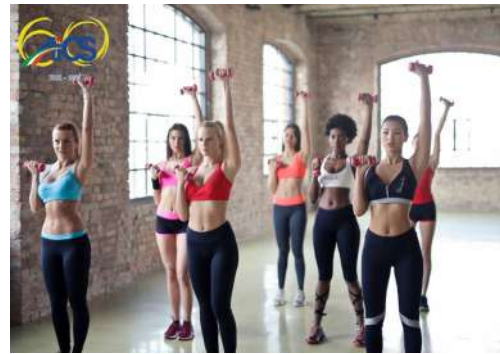
CORSO DI FORMAZIONE ISTRUTTORE GINNASTICA FINALIZZATA ALLA SALUTE ED AL FITNESS 2° LIVELLO - COMPETENZA HIIT