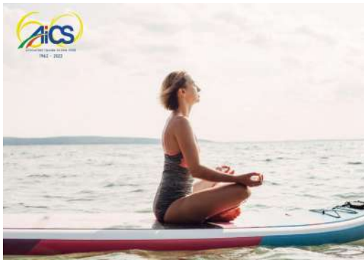
CORSO DI FORMAZIONE PER ISTRUTTORE DI SUP YOGA