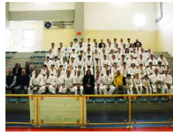
AVANTI TUTTA CON IL SETTORE NAZIONALE KENPO AICS A REGGIO EMILIA