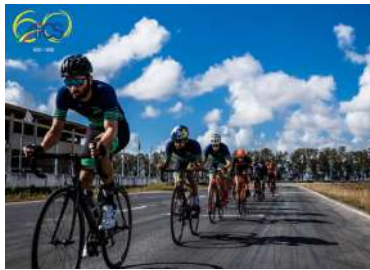
CAMPIONATO NAZIONALE AICS DI CRONOMETRO INDIVIDUALE SU STRADA MASCHILE E FEMMINILE