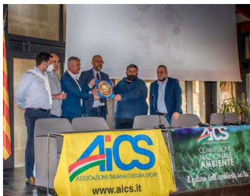
AICS LANCIA I CENTRI DI FORMAZIONE AMBIENTALE: IL PRIMO CENTRO AD ALGHERO, OBIETTIVO ECO-BALNEARI