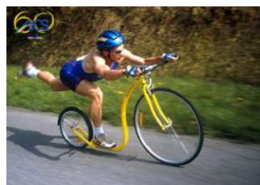
CORSO DI FORMAZIONE PER TECNICO NAZIONALE AICS FOOTBIKE 1° LIVELLO