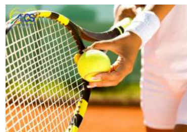
CAMPIONATO NAZIONALE AICS DI TENNIS JUNIOR