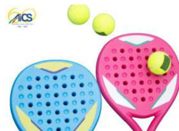
CAMPIONATO NAZIONALE AICS DI PADEL