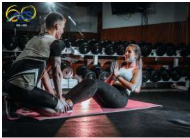
CORSO DI FORMAZIONE PER ISTRUTTORE DI GINNASTICA FINALIZZATA ALLA SALUTE E AL FITNESS – PADOVA