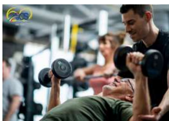
CORSO DI FORMAZIONE PER PERSONAL TRAINER – PADOVA

La Direzione Nazionale AiCS – Settore Nazionale Vela, in collaborazione con Rotary San Pietro Satellite del Roma Tevere, AIPD Onlus e Lega Navale Italiana – Sezione Fiumicino , organizza la Giornata di Vela e Mare , che si terrà Domenica 8 Maggio presso la Darsena di Fiumicino (RM).