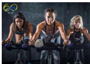
CORSO DI FORMAZIONE PER ISTRUTTORE NAZIONALE DI GINNASTICA FINALIZZATA ALLA SALUTE E AL FITNESS – SPINNING