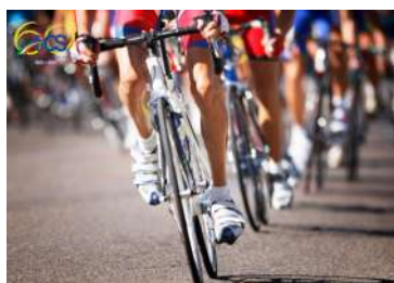
CAMPIONATO NAZIONALE AICS DI MEDIO FONDO SU STRADA CICLOAMATORI MASCHILE E FEMMINILE