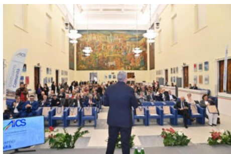
22a Assemblea nazionale AiCS: all'esame, il bilancio sociale 2024

Il 21 maggio alle 17, on line. All'ordine del giorno anche la presentazione e il voto sul bilancio consuntivo 2024