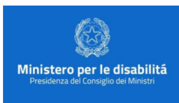
Fondo per l'inclusione delle persone con disabilità: 20 milioni per progetti degli ETS