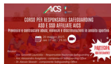
Formazione Safeguarding, doppio webinar il 19 e 20 maggio