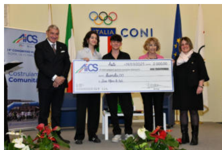
Concorso calendario AiCS 2026, borsa di studio da 2mila euro per gli studenti che disegneranno l'immagine