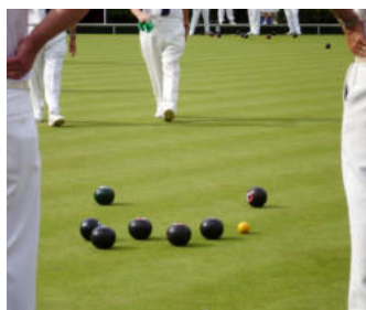
Campionato Nazionale AiCS di Bocce a coppia

A Lignano Sabbiadoro (UD), il 17-18- 19 ottobre. ISCRIZIONI ON LINE QUI ENTRO IL 10 OTTOBRE