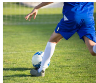
Corso di Formazione per Istruttore di Calcio 1° livello