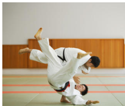
Corso di Formazione per Istruttore AiCS di Aikido