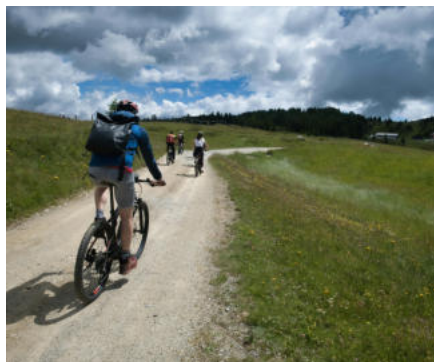
Campionato Nazionale AiCS Cicloturismo

Nel video ufficiale dell'evento puoi rivivere i momenti più belli di una manifestazione che ha visto 70 atleti in campo, laboratori green, attività dedicate ai più piccoli e pillole di sensibilizzazione sui rifiuti