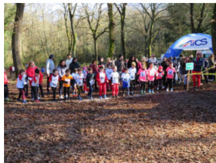
58esima Corsa Campestre AiCS: TUTTI I VINCITORI e le CLASSIFICHE COMPLETE